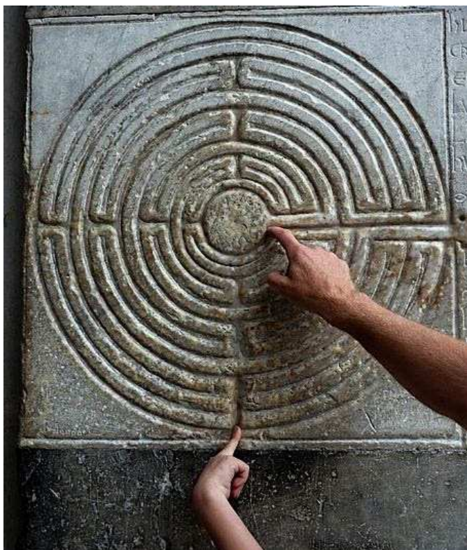
Labyrinth in der Kathedrale von Lucca / Italien